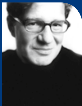
Moderation: Roger Willemsen

„Moon River“ • „Fluch der Karibik“ • „Gladiator“ • „Romeo und Julia“ • „Jenseits von Afrika“ • „Die rote Violine“ • „Die Päpstin“