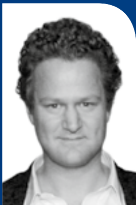
Florian Henckel von Donnersmarck

Kann Musik einen Menschen verändern? Welche Wirkungskraft hat diese Kunst? In seinem Oscar-gekrönten Spielfilm „Das Leben der Anderen“ stehen diese Fragen brennend im Mittelpunkt. Inspiriert wurde Florian Henckel von Donnersmarck durch die Mondscheinsonate und ein Zitat Lenins, wonach man unmöglich hartherzig an einer Revolution arbeiten könne, wenn man gerade Beethoven gehört habe.